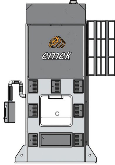
Yan Görünüş Side View